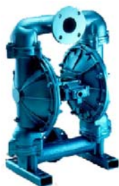
Bombas de membrana