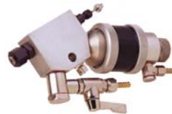
Pistolas dosificadoras de alta presión